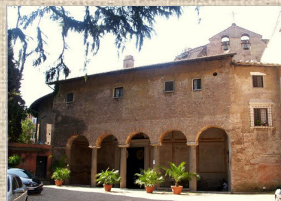
Santo Stefano Rotondo, Róma